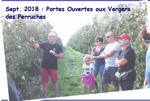
Sept. 2018 : Portes Ouvertes aux Vergers des Perruches