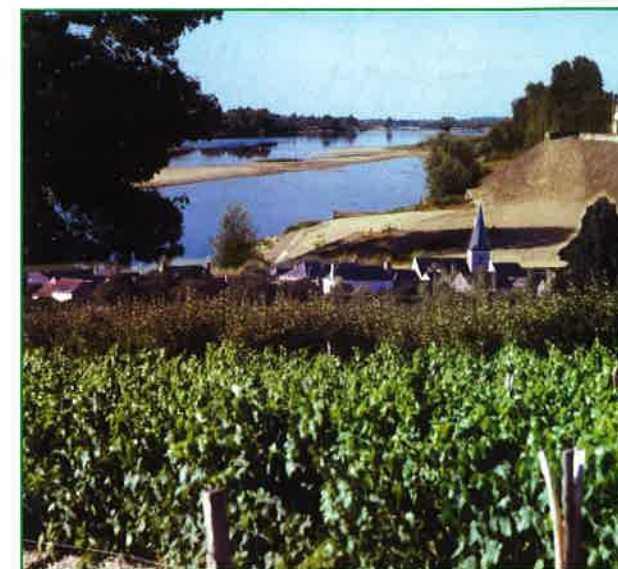
La Loire à La Chapelle-aux-Naux Les vignes et les vergers à Lignières-de-Touraine